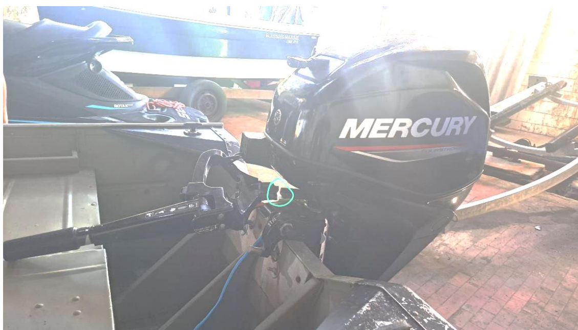
Imagem da peça danificada. Fonte: Acervo CILSJ.

Fonte: https://public-mercurymarine.sysonline.com/Default.aspx?sysname=NorthAmerica&company=Guest&NA_KEY=NA_KEY_VALUE&langIF=por&langDB=por