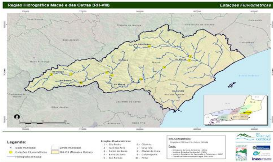
Figura 1 – Delimitação da Região Hidrográfica VIII.

8.2.2. Para início da implementação do Programa de PSA e Boas Práticas na RH-VIII, foram definidas como prioritárias as microbacias números 1, 3 e 4 conforme Figura 2 . Na continuidade do Programa, serão contempladas as demais microbacias citadas na figura 2 . Esta definição foi realizada pelo CBH Macaé, tendo como referência o Diagnóstico Socioambiental na área da Bacia Hidrográfica do Rio Macaé (CBHMO, 2016), elaborado com recursos oriundos do Programa Produtor de Água da ANA, o Plano de Recursos Hídricos da RH-VIII (CBHMO, 2014), e o Atlas dos Mananciais de Abastecimento Público do Estado do Rio de Janeiro (INEA, 2018).