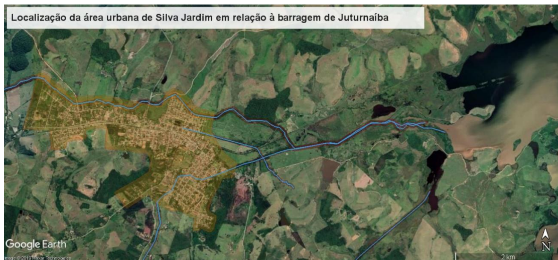
Figura 7 – Localização da área urbana de Silva Jardim em relação ao Reservatório de Juturnaíba