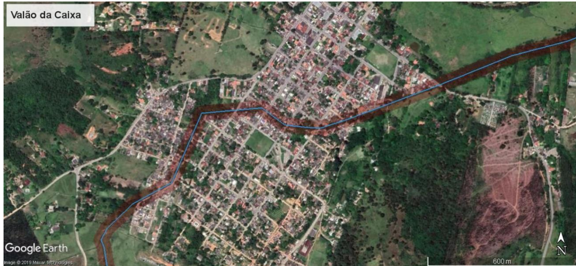
Figura 6 – Densa ocupação às margens do Valão da Caixa, em Silva Jardim