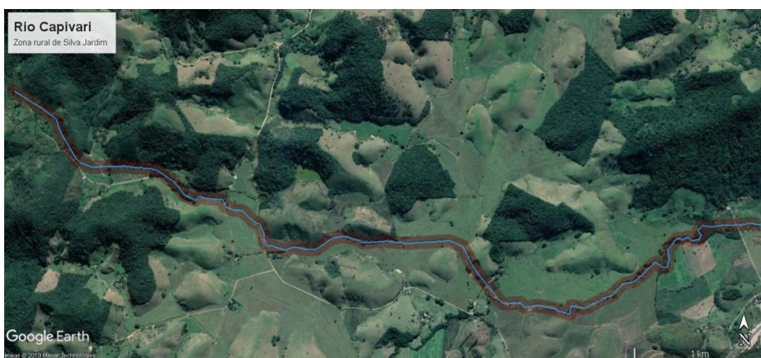
Figura 1 - APP aproximada do rio Capivari à montante da BR 101 (Trecho 01)

2.1. De acordo com o código florestal vigente, para cursos d'água cuja largura esteja entre 10m e 50m, como é o caso do rio Capivari no trecho de Silva Jardim, a área destinada a preservação permanente deve ser de 50m. No trecho rural do município, observa-se que há pouca ocupação das margens, conforme pode ser visto nas Figuras 1 e 2. Entretanto, é possível observar nos distritos centrais que boa parte desta área destinada à preservação encontra-se densamente ocupada, cuja ocupação apresenta características bastante diversificadas, conforme mostrado nas Figuras 4, 5 e 6.