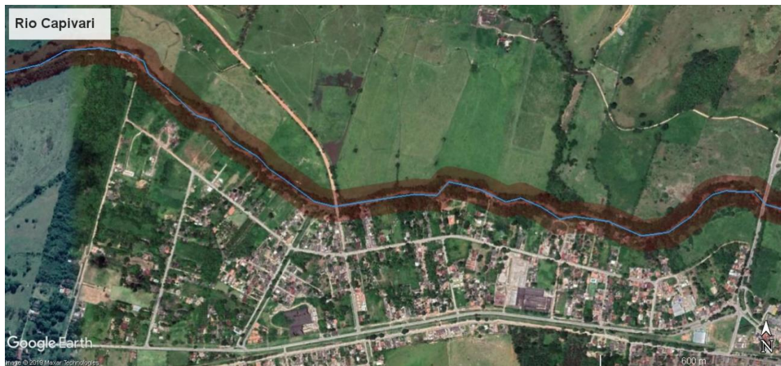
Figura 4 - APP aproximada do rio Capivari em Silva Jardim (Trecho 04)