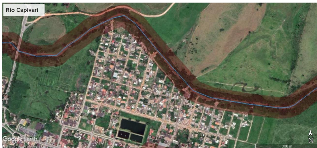
Figura 3 - APP aproximada do rio Capivari em Silva Jardim (Trecho 03)