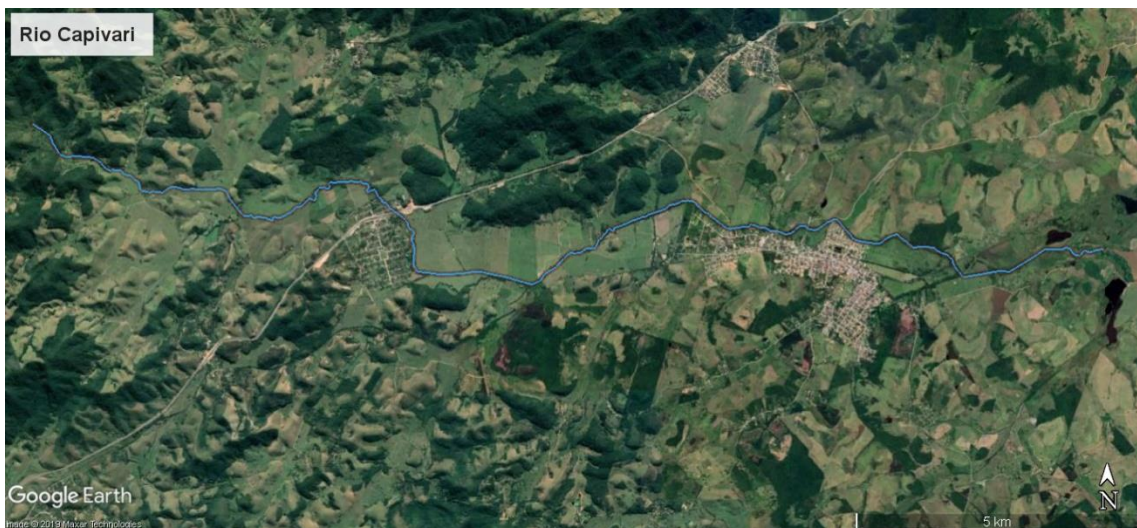
Figura 12 – Trecho do rio Capivari a ser estudado