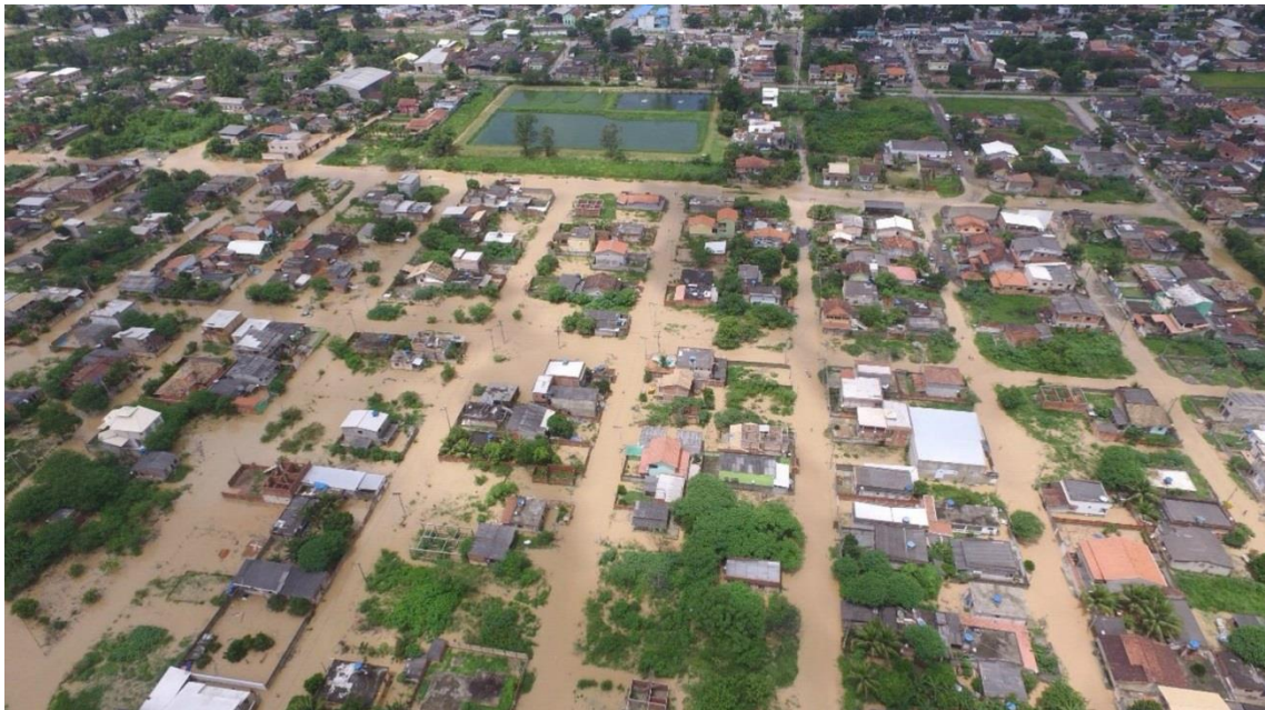
Figura 9 – Inundação em Silva Jardim

2.3. As inundações recorrentes em Silva Jardim trazem graves prejuízos econômicos e sociais, conforme pode ser visto nas Figuras 9 e 10.