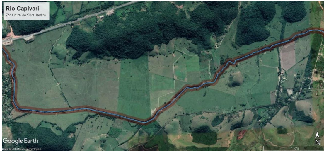
Figura 2 - APP aproximada do rio Capivari à jusante da BR 101 (Trecho 02)