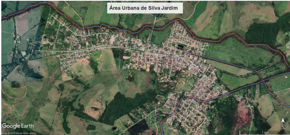
Figura 8 – Rios e canais que cortam Silva Jardim

2.3. As inundações recorrentes em Silva Jardim trazem graves prejuízos econômicos e sociais, conforme pode ser visto nas Figuras 9 e 10.