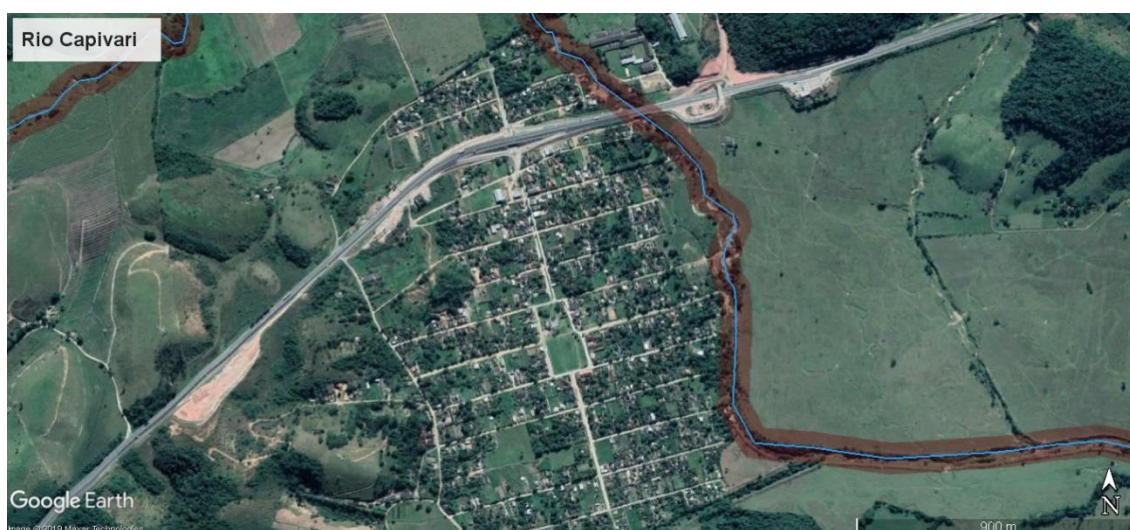
Figura 5 - APP aproximada do rio Capivari em Silva Jardim (Trecho 05)

2.2. A situação dos demais rios e canais que cortam o município também é crítica, como é o caso do Valão da Caixa, mostrado na Figura 6. A Figura 7 apresenta a localização de Silva Jardim em relação ao Reservatório de Juturnaíba, e a Figura 8 mostra o número de rios e canais que cortam a cidade e chegam ao reservatório.