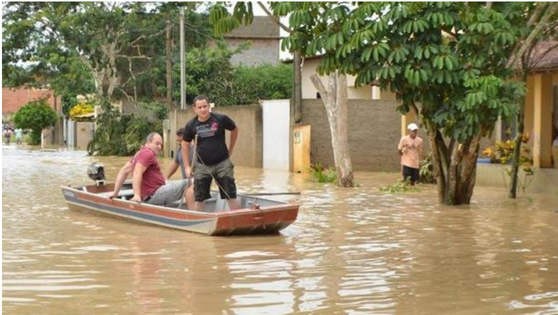
Figura 10 – Moradores sofrem consequências da inundação em Silva Jardim

2.4. Nesse sentido, a identificação das áreas susceptíveis a inundação no município em Silva Jardim será uma ferramenta para que os gestores municipais possam conduzir a distribuição espacial da população e das atividades econômicas de maneira compatível com a preservação dos recursos naturais, de maneira a preservar a integridade física da população e evitar danos socioeconômicos ao município.